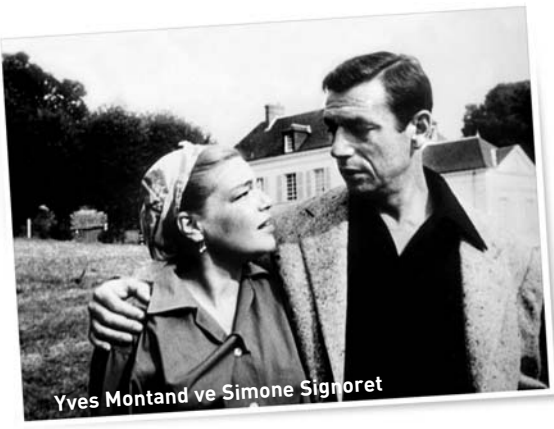
Yves Montand ve Simone Signoret

ileride "Vieux Four" yani "Eski Fırın" adlı çay salonuna serinlemek, bir şeyler içmek için yerleştiğimizde karşıımızdaki masada oturan sevimli yaşlı ihtiyardan, kapıdaki dökme topun hikâyesini dinliyoruz. Adı "Lacan Topu" imiş. Cerisola savaşında, Fransız birliklerince ele geçirilmiş. Savaşın 1544 yılında, İtalyan Guast Dükalığı ile yapıldığını ve zaferle sonuçlandığını büyük bir keyifle anlatıyor Mösyö Bartelier.